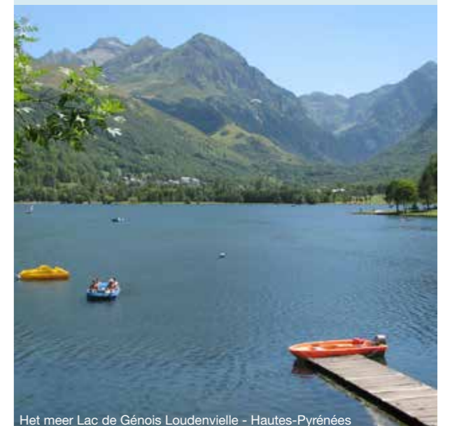
Het meer Lac de Génouïs Loudenvielle - Hautes-Pyrénées

Ook voor een zonnige vakantie op of rond het water zit je hier goed. In vele heldere rivieren en meren kun je lekker baden en spelen met de kinderen. Liever iets actiever? Er zijn tal van watersportmogelijkheden. Ga bijvoorbeeld kanoën, ontdek het raften of duik in de canyons op de grens met Spanje.