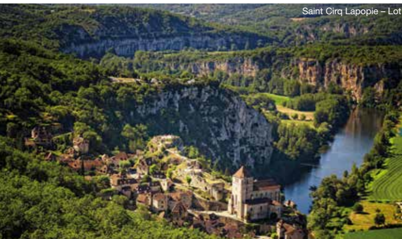
Saint Cirq Lapopie - Lot

Tekst: Marc Erwich