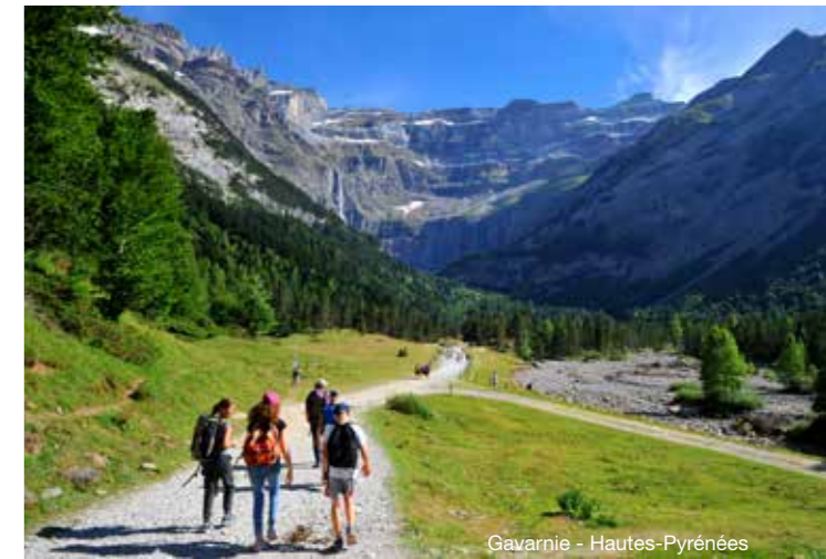
Gavarnie - Hautes-Pyrénées

Met ruim 30.000 kilometer aan bewegwijzerde wandelpaden is de Midi-Pyrénées een waar wandelparadijs. De talloze tochten leiden je langs de mooiste plekken van de streek. In de bergen, langs de wegen naar Santiago de Compostella, rond Toulouse, Conques of Rocamadour. En of je nou een korte wandeling wilt maken met je familie, of een meerdaagse trektocht: al wandelend ontdek je de natuurlijke schoonheid van de Midi-Pyrénées. Ronduit spectaculair is de wandeling rondom het keteldal van Gavarnie. Tijdens deze tocht zal je vooral door de betoverende schoonheid van de Pyreneeën regelmatig naar adem moeten happen. Gelegen binnen een nationaal park geniet je van de woeste aantrekkingskracht van de natuur. Een van de meest indrukwekkende watervallen van Europa stort zich hier in de diepte (422 m vrije val), en om je heen een muur van bergreuzen.