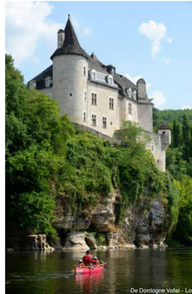
De Dordogne Vallei - Lot